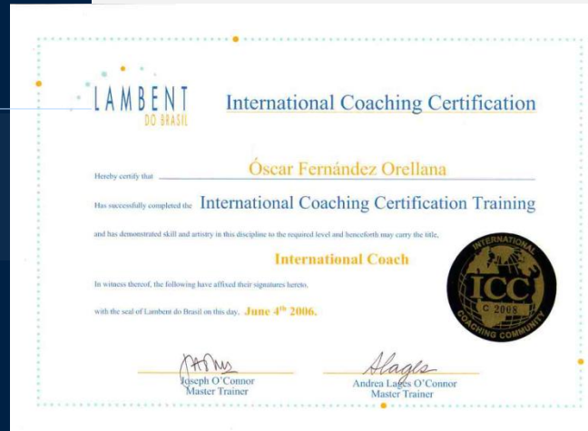
Certificación en coaching