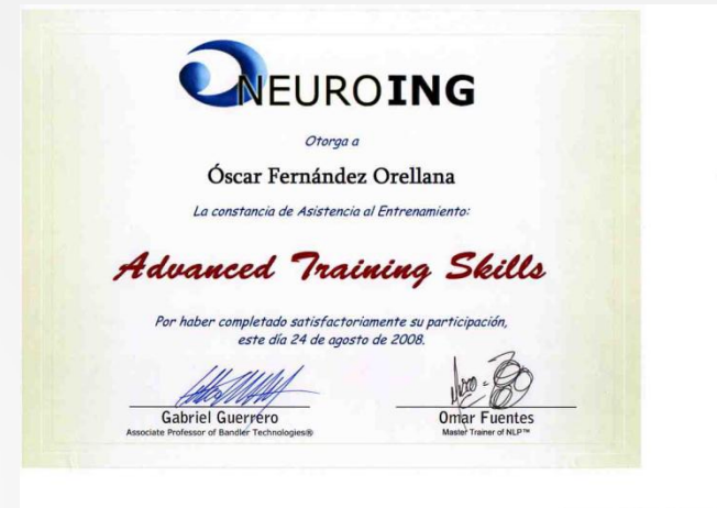
Certificación en Habilidades para la formación y entrenador de formadores